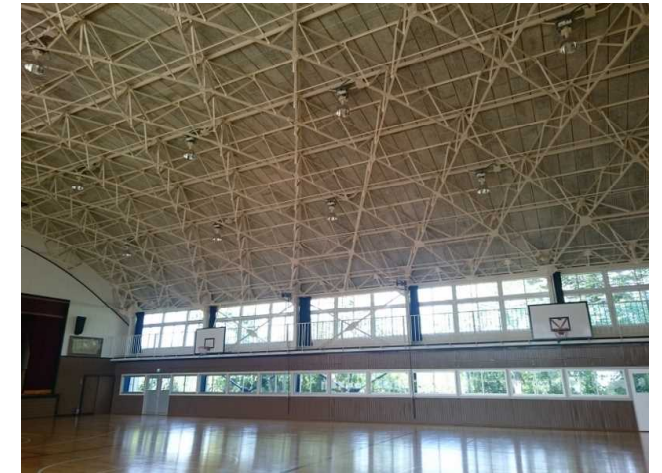
各学校・体育館の耐震化とリフォーム推進 (秋山中学校体育館)