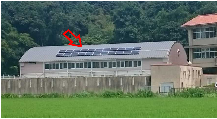
指定避難所 太陽光発電設置 (松岡中学校)