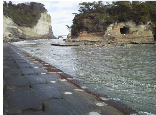
高戸小浜 堤防の穴埋め