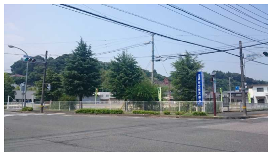
旧庁舎跡地に建設