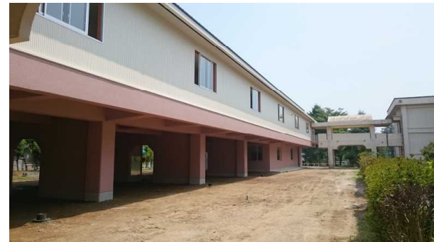
秋山小学校北校舎改築 1階駐車場整備