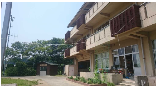
各学校・幼稚園に ミストシャワー設置