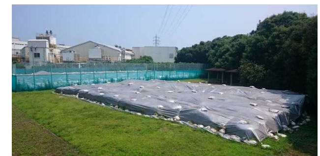
放射性物質汚染土 除染推進 (除染土保管)