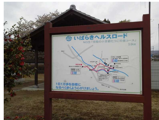
いばらきヘルスロード指定推進 (穂積邸～松岡城址公園コース)