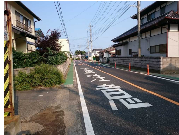
国道461号線 秋山小学校通学路安全対策