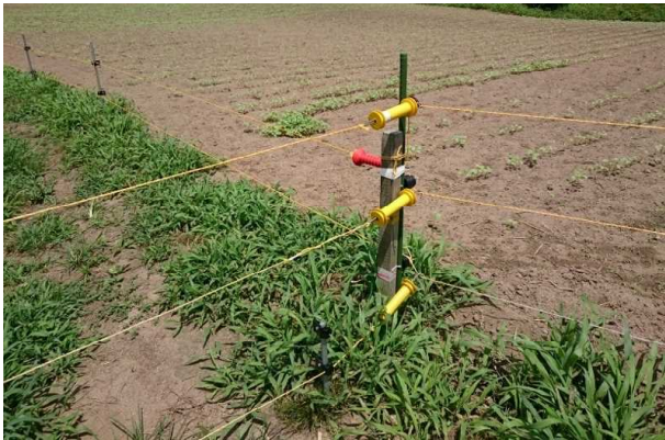
イノシシ防除電気柵 (下君田)