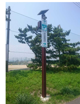
避難誘導灯サイン 市内93カ所設置