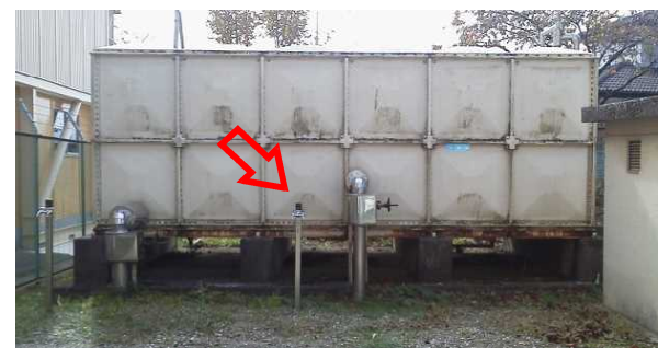
指定避難所非常用給水タンク蛇口取り付け (秋山小学校)