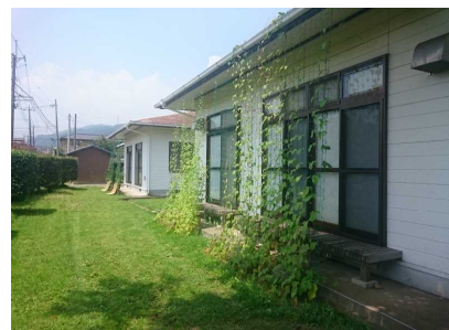
公共施設に緑のカーテン推進 (山手集落センター)