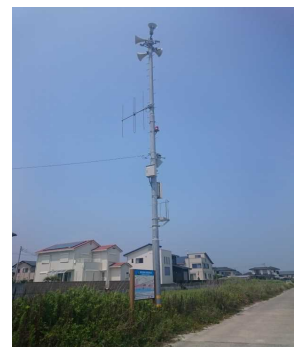
防災行政無線拡声器 市内34カ所設置