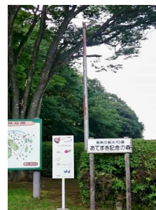
LED照明推進 (森林公園)