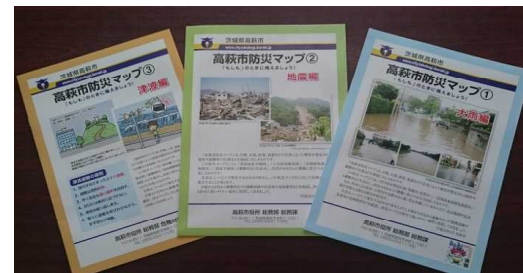
全戸配布した防災マップの作成推進 津波編・地震編・大雨編の3種類

3.11の教訓から、以前の防災計画を全面見直しさせ、震災復興等対策特別委員会で詳細にチェックを行いました。災害はいつどのような形で起きるかわかりません。その対策も臨機応変の必要があることから、計画の追加や変更が素早くできるように、ファイル式での作成を提言し実現しました。全ての地域防災対策はこの計画によって進められています。