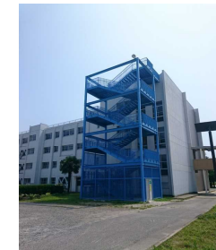
津波避難階段 (高萩中学校)