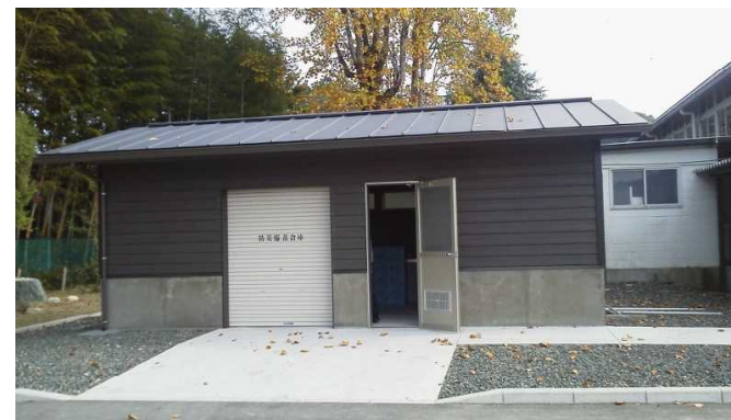
指定避難所防災備蓄倉庫 (松岡小学校)

震災によって涸れてしまった井戸や破損した水道を修復する支援として、罹災した住宅の修繕と同様に助成できるよう制度を改正させました。